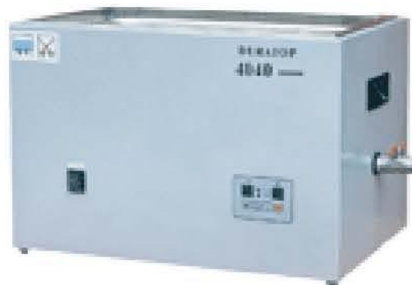
MODELO 4040 & 6040